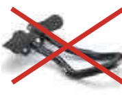
アタッチメントバー