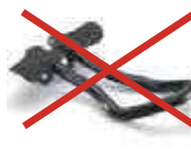
アタッチメントバー