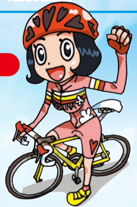
“ハルヒル” イメージキャラクター はるなちゃん イメージキャラクターのイラストは「弱虫ペダル」の作者・渡辺航先生のオリジナルです。