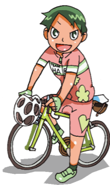
ハルヒル・イメージキャラクター 「のぼるちゃん」