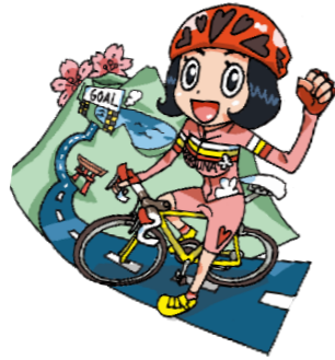
ハルヒル・イメージキャラクター 「はるなちゃん」

*イメージキャラクターのイラストは「弱虫ペダル」の作者・渡辺航先生のオリジナルです